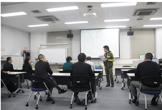
AEDの基礎知識と使用方法について講義