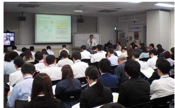
「100年マンション研究室」の勉強会風景