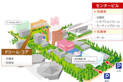
ソフトピアジャパンセンター全体図