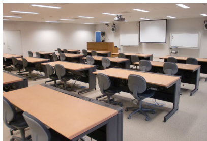
3F マルチメディア実習室1