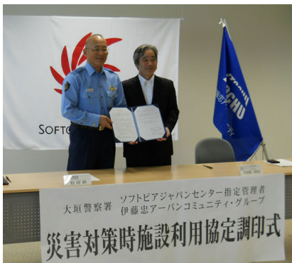
協定調印式の様子

当社は、今後も万一の災害発生時に本施設が災害対策拠点としての機能を万全に発揮出来るよう、施設運営を行って参ります。